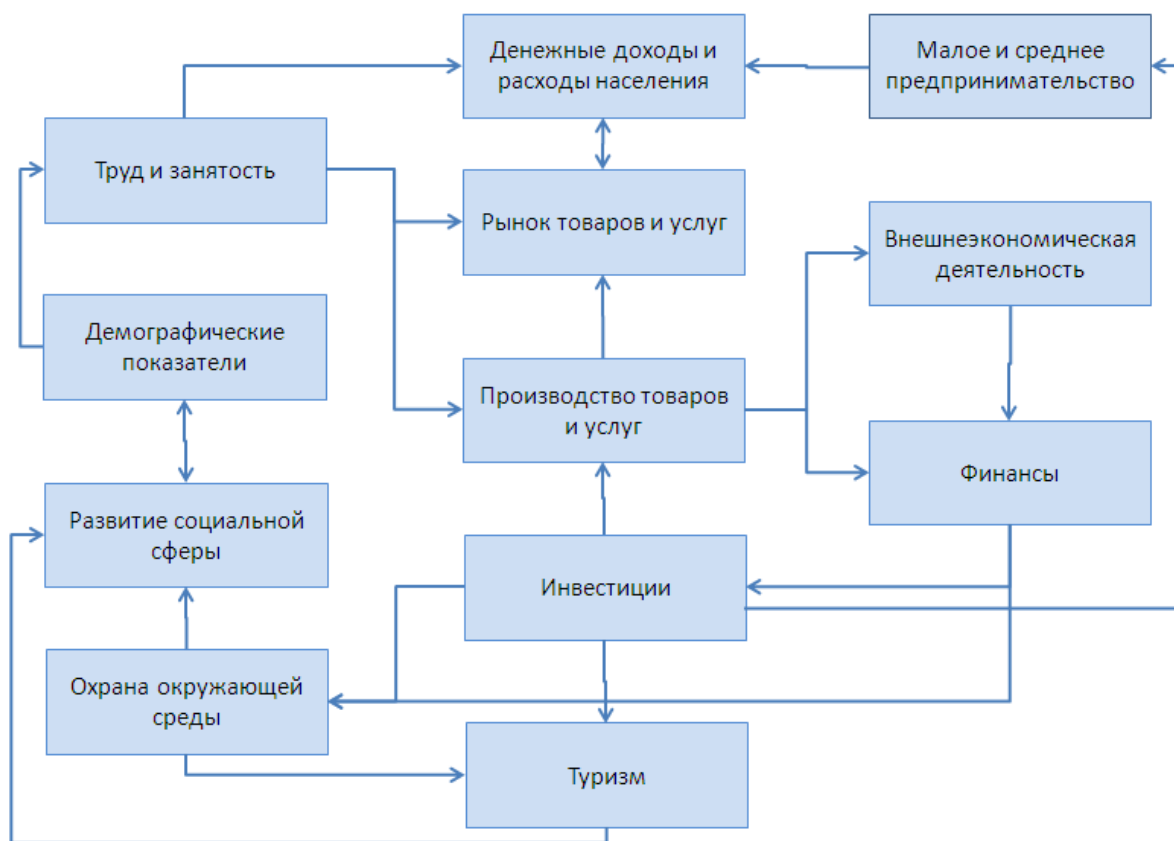
Рисунок 2. Взаимодействие между укрупненными блоками формы 2п

С целью получения согласованных и непротиворечивых прогнозов показателей социально-экономического развития субъекта Российской Федерации при выборе объясняющих переменных необходимо учитывать существование взаимосвязи и взаимодействие между прогнозными показателями. Например, существует устойчивая зависимость между динамикой населения, параметрами развития экономики и социальной сферы. Демографические показатели оказывают влияние на трудовые ресурсы, а последние оказывают влияние на развитие экономики, а также служат исходной базой для прогнозов объемов и структуры потребления, доходов и расходов населения. Взаимосвязи между рассматриваемыми показателями социально-экономического развития субъекта Российской Федерации по укрупненным блокам формы 2П представлены в виде графа ниже (см. Рисунок 2).